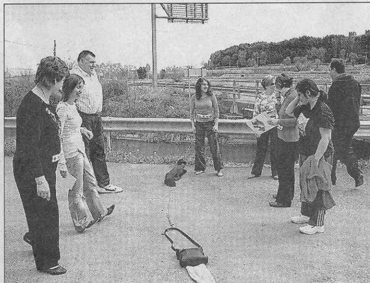
Una gimcana va donar a conèixer la feina de Creu Roja.

Durant part del matí, tots els voluntaris van poder