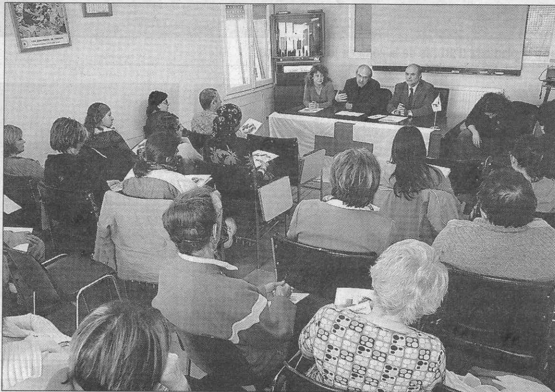
Una cinquantena de persones van participar de la Trobada de Voluntaris.

Una gimcana va donar a conèixer les activitats que es realitzen